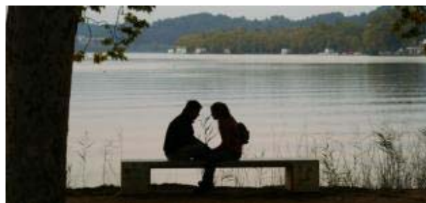
La primavera la sangre altera Agencias.

EP Un 40% de los españoles considera la primavera como la estación "perfecta" para iniciar un romance pues la llegada del buen tiempo tiene "especial influjo" en la conducta amorosa, según un estudio de Harris Interactive recogido por mobifriends.com.